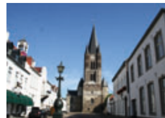
De Abdijskerk en Plain Thorn NL

De zonnescijf doorgekruisd en geaard verwijst naar het lijden van Christus en de vier aardse hemelsrichtingen.