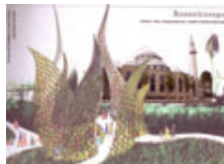
Rosenpalast van Marcel Kalberer Duisburg-Marxloh D

De HEMELZUIL uit de Pauluskerk Dortmund naar Den Haag Essen Hamm-Uentrop