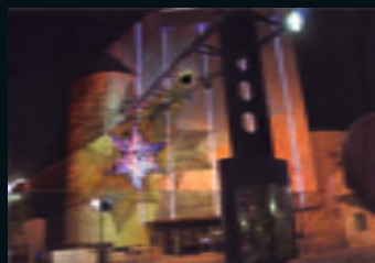
Cultural Center Netanya Netanya IL