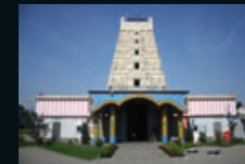
Sri Kamadchi Ampal Tempel Hamm-Uentrop D