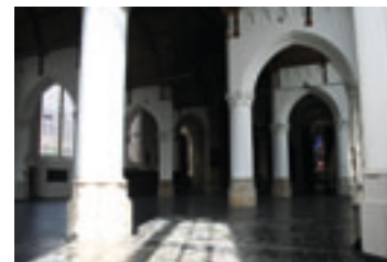
Grote Kerk Den Haag NL

Vennoten en officiële sponsors van RUHR.2010