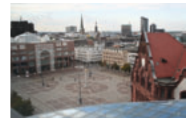
Rathaus am Friedensplatz Dortmund D