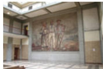
Licht- und Lohnhalle, Zeche Lohberg Dinslaken D